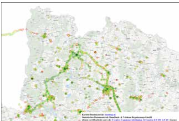
Detailansicht NÖ Nord, Downloadraten Mobil + Festnetz via RTR-Netztest, Daten 09.2015 – 01.2016